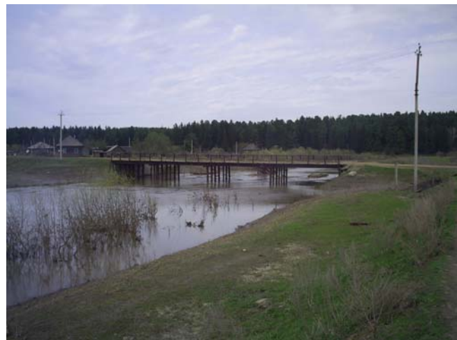
Рисунок 12а, б

Из Пашково ведёт очень широкая размытая глиняная дорога. Судя по глубине колеи проехать можно разве что на танке или самолёте (рис. 13а). Но местные лихачи объезжают ухабины по ёлкам. Наверное, поэтому весь придорожный лес усыпан деталями от различного транспорта.