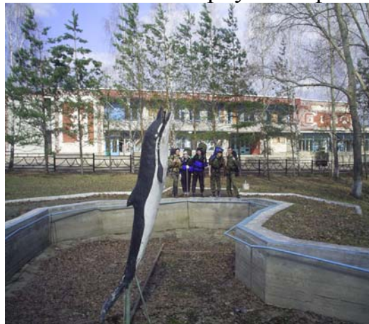
Рисунок 4а, б

Далее по грунтовой дороге, петляющей среди полей доходим до развилки на пос. Акацию (Бурлаково). Здесь устраиваем ночёвку(19:00)