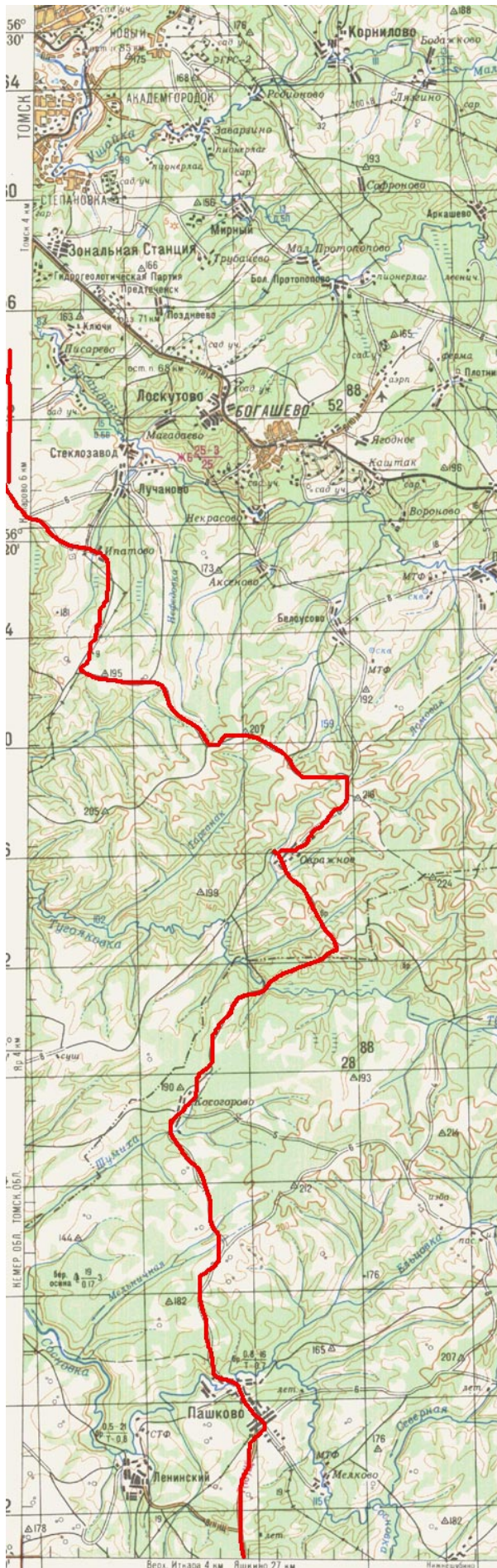
Схема движения 4-6 дни.