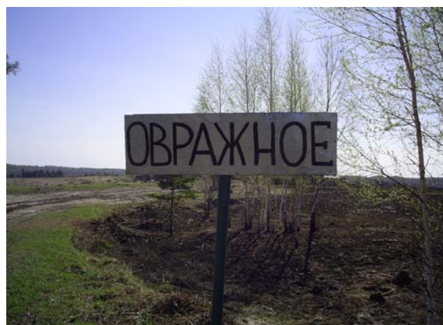
Рисунок 15а, б

Далее нас ждал обед. Затем твёрдая каменная трасса. В 17:05 мы с облегчением свернули на мягкую грунтовую дорогу, на которой нас ждал очередной сюрприз. Обещали тригопункт и ур. Ключи, получили поставленное на Берендейском марафоне 2005 г. КП 16, шифр РК4 (рис. 16). Пройдя ещё два часа по этой дороге, встаём на последнюю в этом походе ночёвку, не доходя 1 км до развилки на Лучаново (19:40)