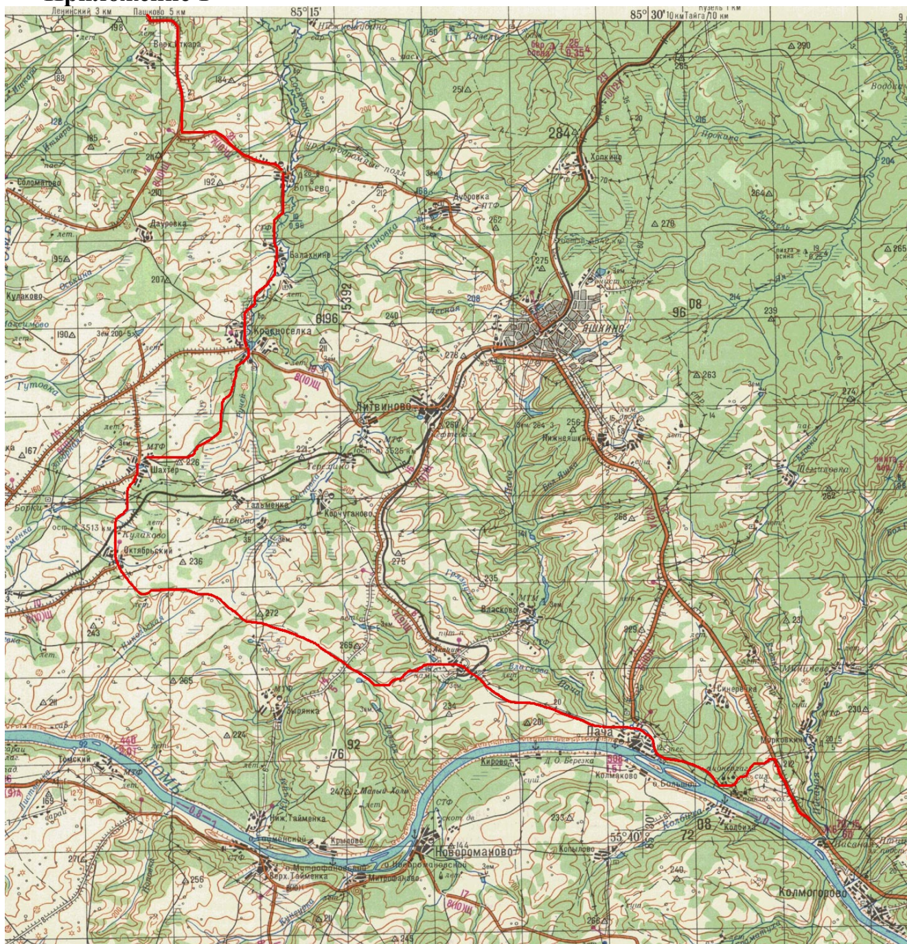
Схема движения 1-3 дни