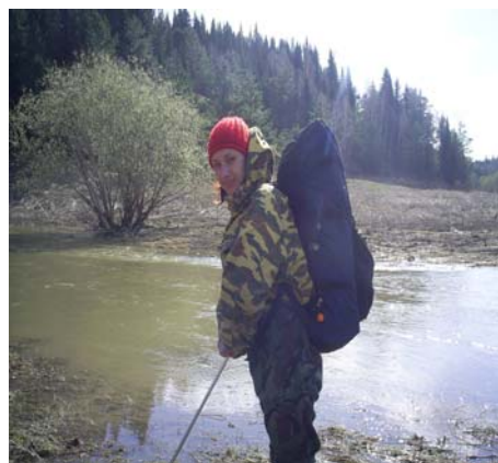
Рисунок 14а, б

Миновав заманчивые воды, поднимаемся на пригорок. Всех привлекает ровное гудение, оказывается это пчёлы. На горе кто-то построил пасеку. Но хозяина дома не оказалось, или он просто к нам не вышел. Пройдя метров 500, подошли к развилке. Основная дорога уходила в Овражное, старая, еле видная среди молодой поросли, в нашем направлении. Метрах в 30 впереди по старой дороге снова упало дерево. Решено было не идти в осиновый лес (а именно такой в пределах видимости рос в направлении старой дороги), а обойти его через Овражное, по верхам — через берёзовые вырубki.