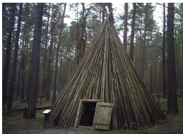
Рисунок 2а, б

Посещение музея стоит 50 руб. (для студентов 30 руб.). Его изюминка – наскальные росписи (петроглифы). Хотя из-за половодья, по традиции (р. Томь) их снова никто не увидел, на скалу с росписями было не пройти. Зато все любовались парящей над водами Томи видеокамерой.