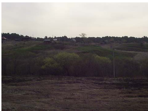
Рисунок 17а, б