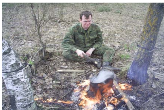
Рисунок 3 а ,б ,в

Хорошие ориентиры на этом участке пути: два населённых пункта на противоположном берегу и два острова на реке, правда, один из них значительно погружён в воду.