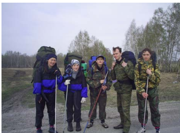
Рисунок 5а, б, в

Далее дорога выходит в поля, судя по затоплению рисовые ☺. Но вода тёплая и чистая. Занимаясь водными процедурами, а заодно и мытьём обуви, не заметили, как подошли к пос. Октябрьскому. Обещанного картой летника мы не увидели, но вот одинокие строения просматриваются хорошо, даже с дороги.