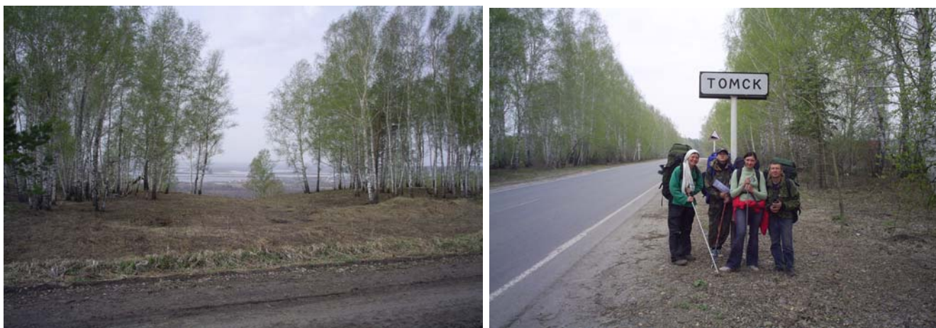
Рисунок 17, в, г