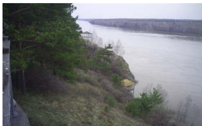
Рисунок 1а, б

С первого взгляда видно, что у музея дела идут хорошо. К услугам гостей сауна, дом Деда Мороза круглый год и многое другое. Юрты и землянки уютно соседствуют с произведениями современной архитектуры и вооружённой охраной (рис.2). Всем запомнилась фраза дежурного, который недоверчиво посмотрел на нас и по рации сказал кому-то: