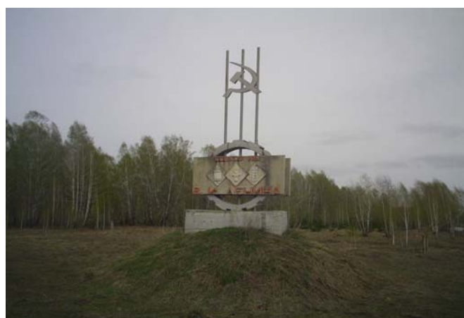
Рисунок 11а, б

Посёлок (рис. 12а) же встречает нас запахом свежей выпечки и автобусом, с которого бойко продают похоронные принадлежности. Нам тоже предложили