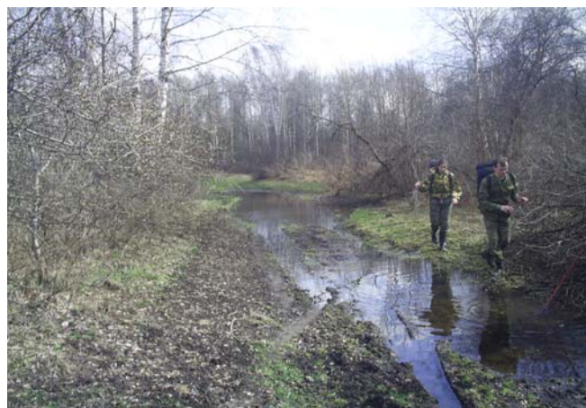
Рисунок 13а, б

Входим в пос. Косогорова в 17:50. Типичный дачный посёлок, здесь туристом никого не удивишь.