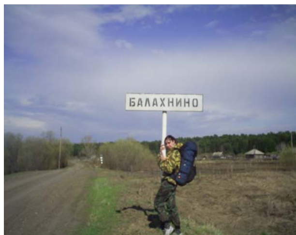
Рисунок 9а, б

Жители пос. Балахнино от соседей не отставали... Однако поинтересовались куда мы держим путь, так как этот посёлок конечная остановка. Узнав, что мы направляемся в Ботьево, очень удивились, но сказали, что дорога туда есть. И это действительно так, только то, что местные жители назвали дорогой на самом деле уже давно тропа. Транспорт здесь мало используется, а река делает своё дело, подмывает берега, рисуя причудливые обрывы. Поэтому, чтобы не сбиться с пути надо внимательно следить за поворотами р. Сосновки.